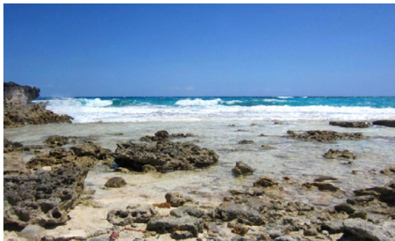
På utsidan av ön blåste det bra