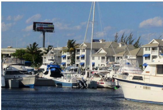
seaQwest på plats i Marina Bay

Bredvid marinakontoret ligger Rendezvous; en omtalad restaurang med bra mat.