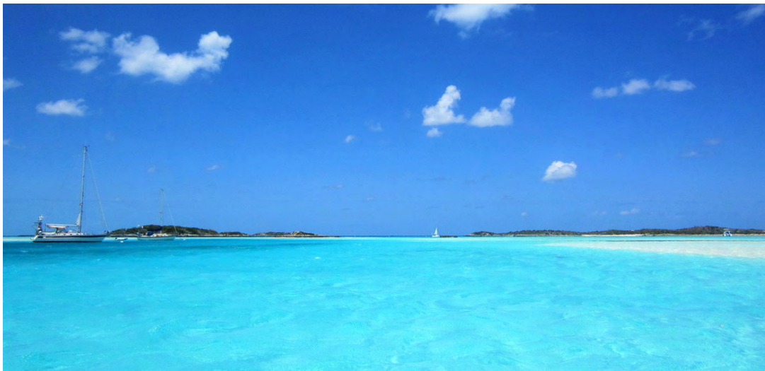
seaQwest i den läckra lagunen vid Warderick Wells