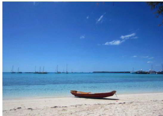
Ankringen, stranden och marinan vid Staniel Cay

Strax intill Staniel Cay ligger Thunderball Grotto, en naturlig undervattensgrotta där bland annat delar av James Bond-filmen Thunderball spelats in. Vid högvatten ligger ingången under vatten men vid lågvatten simmar snorklare lätt in. I taket är det öppet och solljuset strilar ner i grottan som är fylld av färggranna fiskar. Populärt är att försöka få med sig lite brödsmulor och liknande att mata dessa med. Även detta satte våra förkylningar stopp för men andra som varit där var helt hänfödda.