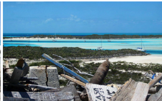
Från Boo Boo Hill har man fin utsikt över lagunen

Något vi sett, och uppskattat, många gånger på vår resa är att man är sparsam med förbudsskyltar. Så mycket trevligare det är att mötas av uppmaningar, som: "Take only photographs... Leave only footprints!"