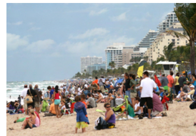
På stranden tillsammans med 475 000 andra...

Sista helgen i april var det "Lauderdale Air show", två hela dagar med spektakulära flyguppvisningar. Lördagen grydde med grå himmel och regndroppar hängande efter en vecka med strålande fint väder. Det var fem år sedan sist så folk gick man ur huse denna dag. Detta är de bästa flygarna Amerika kan visa upp. Och visst kunde de flyga!