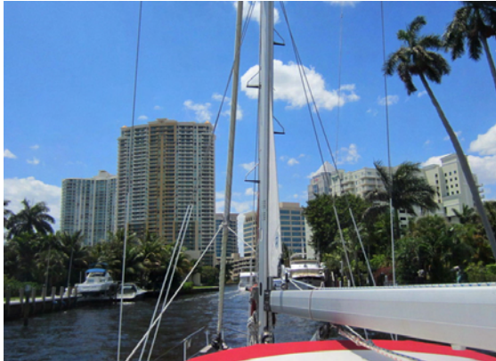
seaQwest längs New River genom downtown

New River flyter genom Fort Lauderdales "downtown" och är tillräckligt djup för större båtar ytterligare några distans in i landet. Floden kantas i city av höghus men annars av bostäder med egen brygga längs kanten. En mycket trevlig färd med fyra broar som måste öppnas för att vi skall komma igenom.