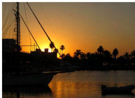
Solen går upp över Las Olas mooringfield

Själva fullföljde vi just här vår egen Great Loop efter ett år och 6 dagar (vi startade från just Fort Lauderdale den 14 april 2011). Ett fantastiskt år då vi avverkat över 6 500 Nm och träffat otroligt gästvänliga människor. Färden har gått genom 21 olika stater (17 med båt och ytterligare 4 via bil) och vi har sett allt från storstad till byhåla. Från vildmarken i norr till den djupaste södern. Från societeten i ost till den vackra highway 1 i väster.