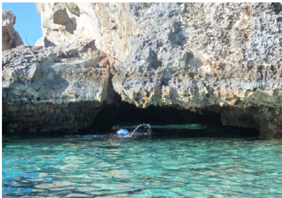
Ingången till Thunderball Grotto, vid lågvatten

Strax intill Staniel Cay ligger Thunderball Grotto, en naturlig undervattensgrotta där bland annat delar av James Bond-filmen Thunderball spelats in. Vid högvatten ligger ingången under vatten men vid lågvatten simmar snorklare lätt in. I taket är det öppet och solljuset strilar ner i grottan som är fylld av färggranna fiskar. Populärt är att försöka få med sig lite brödsmulor och liknande att mata dessa med. Även detta satte våra förkylningar stopp för men andra som varit där var helt hänfödda.