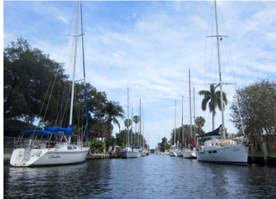
Många av villorna har egen båtplats i floden

Efter downtown är man ute ur evakueringszonen för en eventuell orkan och här finns 15-20 marinor och all kringsservice för båtar, bl.a. ett stort varv för superyachter.