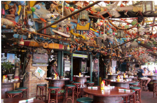
Irländsk pub vid Riverwalk med marina prylar i taket

En dag tog vi dingens ner till Downtown och 20 minuter senare strosade vi på den fina gångvägen som man byggt längs floden i centrum, "Riverwalk". Här ligger Fort Lauderdale's "Historic District" med hus som uppförts i början av 1800-talet. Det är en lustig detalj vi märkt på många platser i Amerika. Man vill gärna visa upp historia men den startar alltid med den vite mannen. På något sätt tycks man glömma att landet varit bebott långt innan de kom hit!